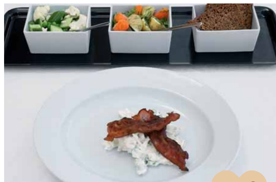
♥ Chicken salad with three lettuces and smoked bacon ♥ Ensalada de pollo con verduras de verano y bacon ahumado