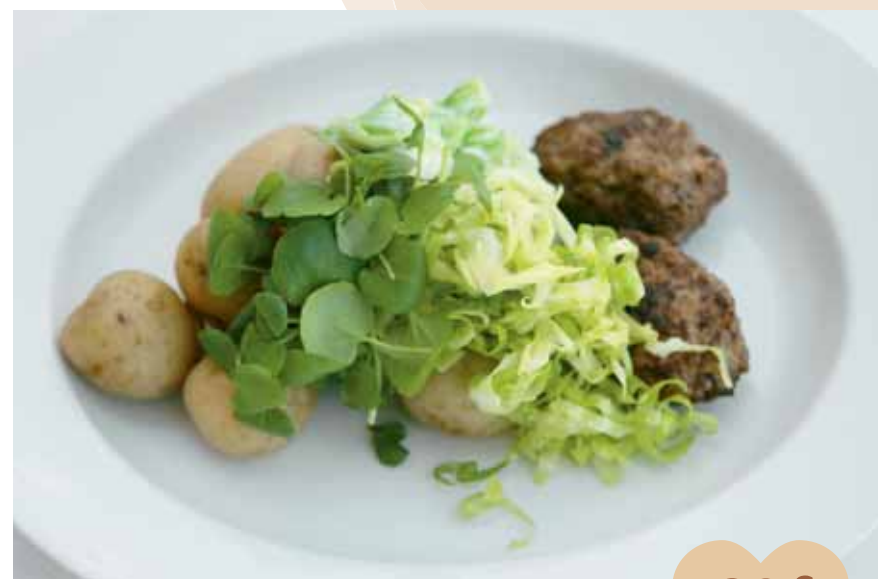
♥ Pork and veal rissoles, summer potatoes and cabbage of the season ♥ Albóndigas de carne, patatas tempranas y verduras de veranot