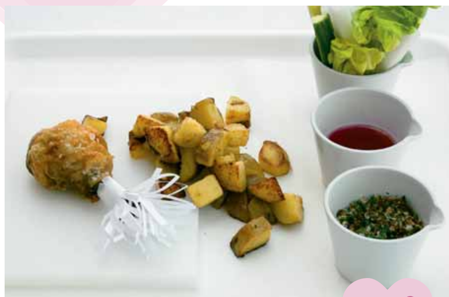
♥ Fried chicken drumstick with finger potatoes ♥ Muslo de pollo frito con patatas cocidas

♥ A Hugo le gustan las comidas repletas de socialización y tradición .