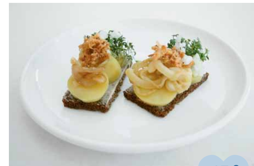
♥ Classic Danish potato open sandwich ♥ Smørrebrød de patata