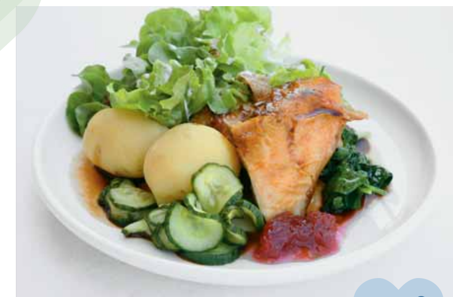
♥ Parsley braised chicken, summer potatoes, pickled cucumber slices and rhubarb compote ♥ Pollo frito al perejil con patatas de verano, rodajas de pepino macerado en vinagre y compota de ruibarbo