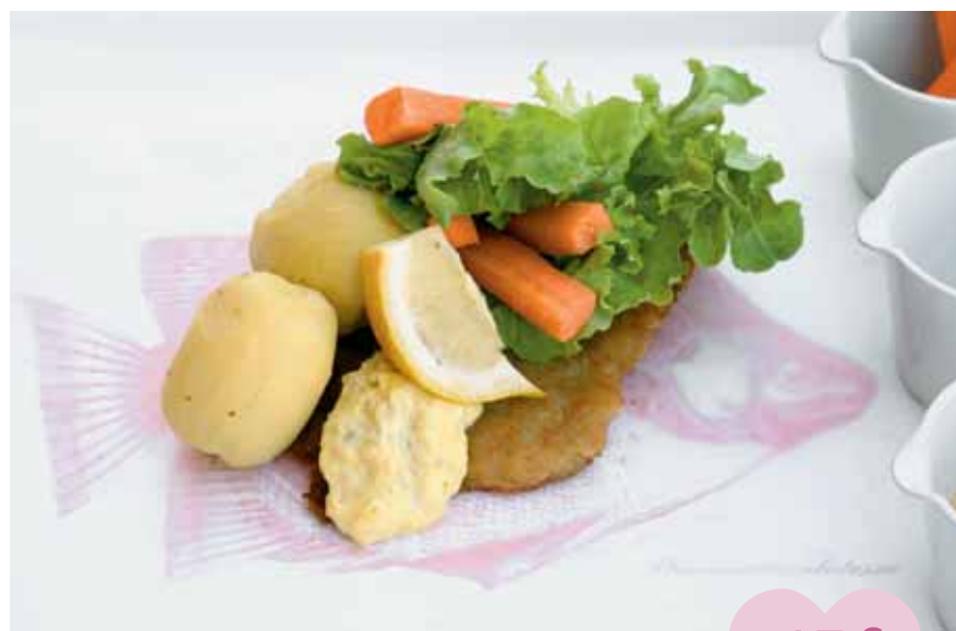
♥ Fried fillet of plaice, summer potatoes, and remoulade ♥ Filete de pescado con patatas tempranas y salsa remoulade