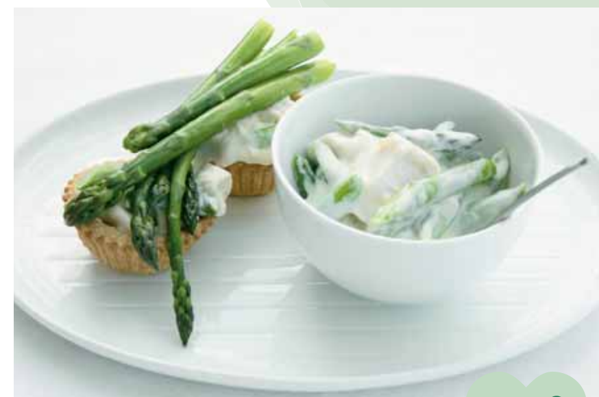
♥ Vol au vents with filling of asparagus and chicken stew ♥ Tartitas de pollo y espárragos estofados