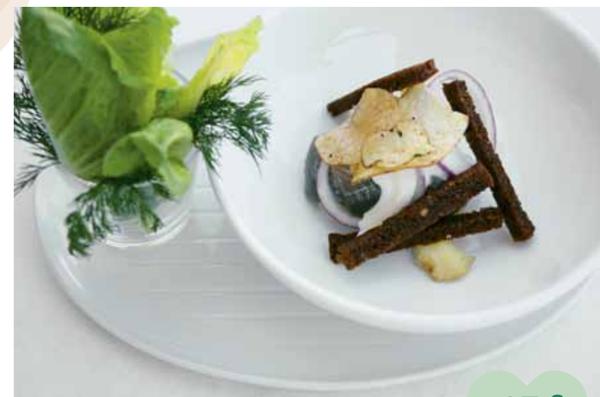
♥ Pickled herring and summer potatoes ♥ Arenque marinado con patatas tempranas